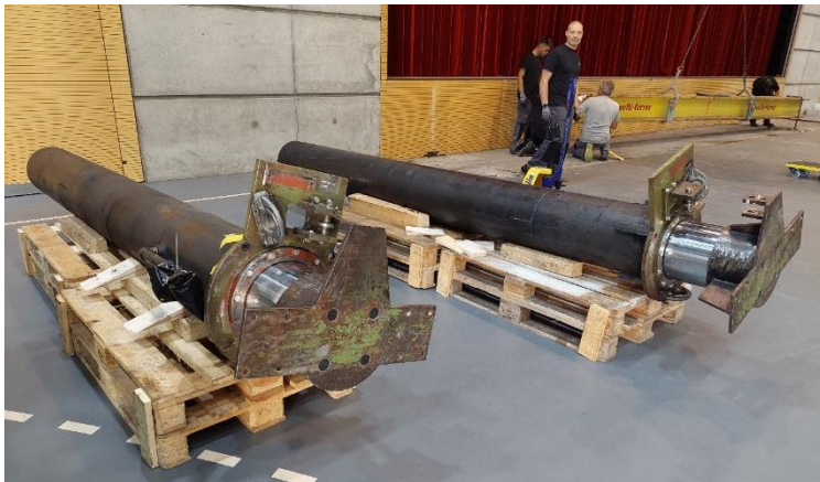
Revidierte Hydraulik-Zylinder der Vorbühne