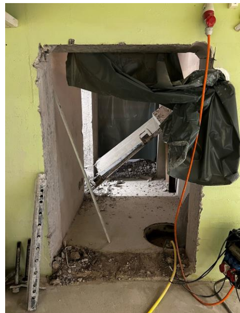
Neuer Durchgang zu den WC-Anlagen im Untergeschoss